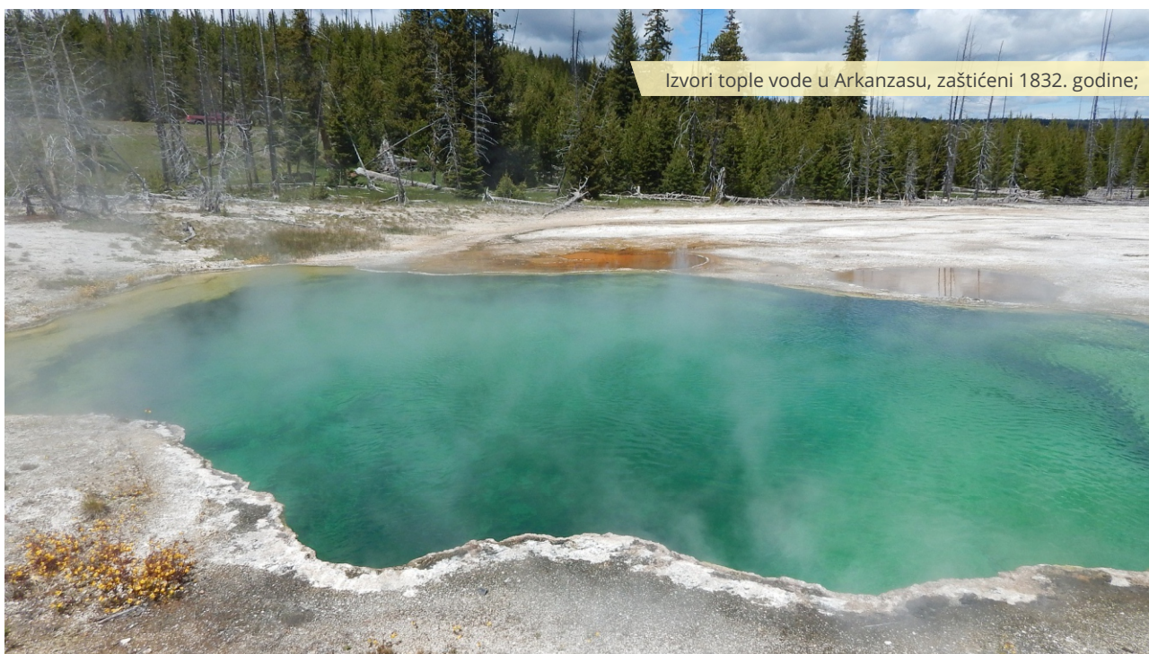
Izvori tople vode u Arkanzasu, zaštićeni 1832. godine;

Nakon Toplih izvora u Arkanzasu, sledeće veliko zaštićeno područje u SAD bila je Josemitska dolina (Josemite Valley), 1864. godine. Za njenu zaštitu, kao i za zaštitu Sekvoja nacionalnog parka (Sequoia National Park) 1880. godine, najzaslužniji je bio prirodnjak Džon Mjur (John Muir), koji je obrazovao organizaciju „Sierra Klub“, prvu nevladinu organizaciju u svetu koja se zalagala za očuvanje prirode. Prvi nacionalni park u svetu, „Jelouston“ ( Yellowstone National Park ), proglašen je 1872. godine i stavljen pod nadzor federalnih vlasti kao „javno područje u kojem ljudi mogu da uživaju“.