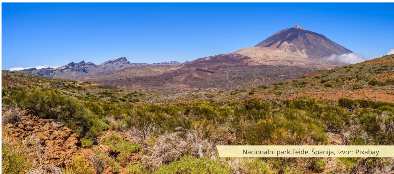
Nacionalni park Teide, Španija

Uprava u zaštićenim prirodnim dobrima u Španiji posvećena je izgradnji partnerstva sa lokalnom zajednicom i preduzetnicima koji žele da posluju po konceptu održivog razvoja. Parkovi su tako postali punktovi za održivi razvoj i zeleno poslovanje. 10