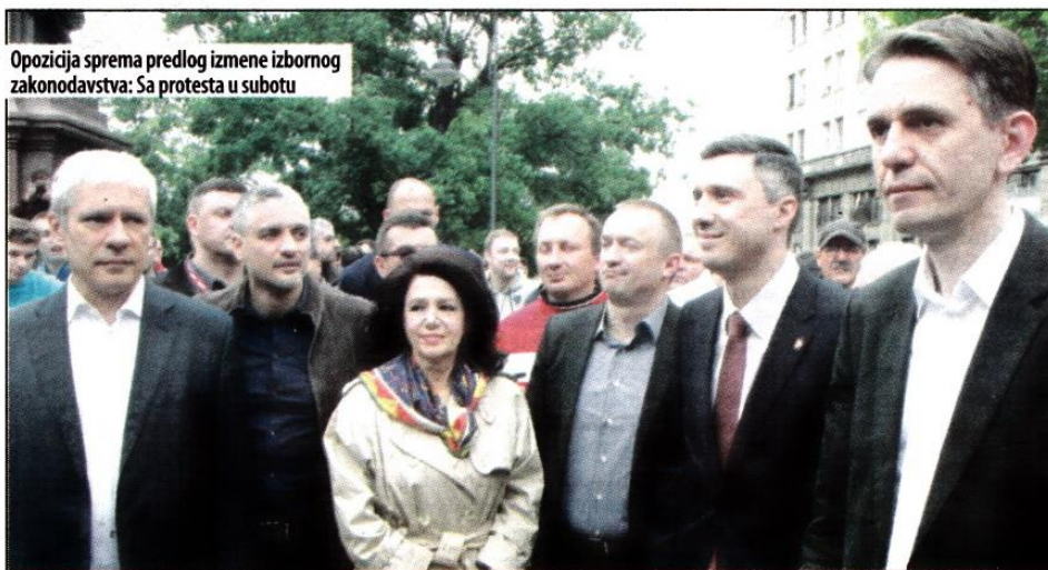
Opozicija sprema predlog izmene izbornog zakonodavstva: Sa protesta u subotu